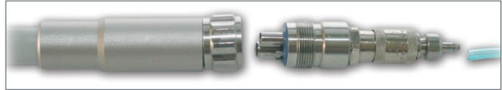
Connector MidWest Varenr. 1930