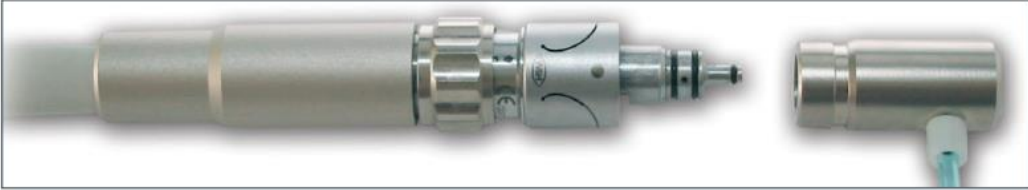
Connector S til Sirona Varenr. 1935